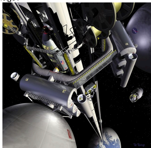
Ilustraciones del ascensor espacial

Tal vez algún día, si estos científicos tienen éxito, podríamos llevar a personas y materiales al espacio de una manera fácil y barata. Y si cualquier ciudadano pudiese viajar al espacio, eso significaría cambios impresionantes en nuestras vidas.