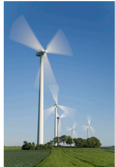
Granja de viento

Although Aunque no podemos ver el aire, podemos sentirlo y observar cómo interactúa con otras cosas, como rehiletes o turbinas de viento gigantescas. Las turbinas de viento reúnen la energía del aire en movimiento, la cual puede ser transformada en electricidad.