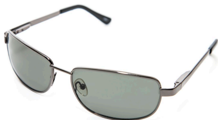
Algunos anteojos se oscurecen al tener contacto con la luz solar

Los cambios en la estructura molecular de un material son demasiado pequeños para ser vistos a simple vista, pero a veces podemos observar los cambios correspondientes en las propiedades del material. En esta actividad, las cuentas UV cambian de color a consecuencia de cambios a un nivel nanométrico en la forma de las moléculas que componen el tinte.