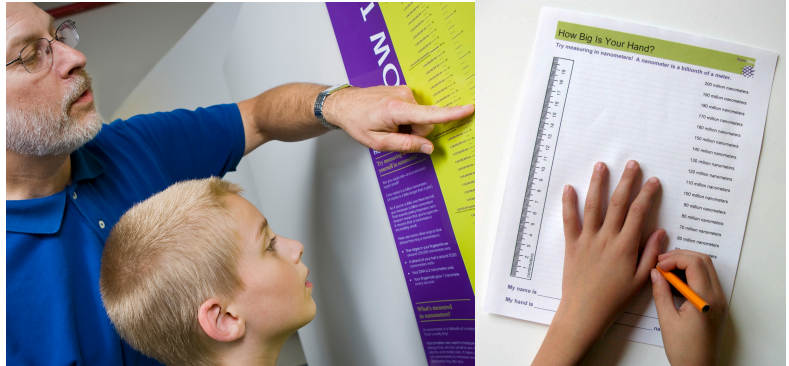
¡Intenta medirte en nanómetros!