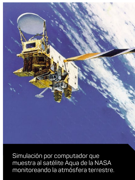
Simulación por computador que muestra al satélite Aqua de la NASA monitoreando la atmósfera terrestre.

En los Estados Unidos los ciudadanos científicos pueden participar desde su casa, la escuela, y en su comunidad en las investigaciones relacionadas con las nubes. Utilizando la aplicación GLOBE Observer, la gente puede recopilar información sobre las nubes y compartirla con los científicos que colaboran con la NASA. Los ciudadanos y los científicos trabajando en conjunto realizan investigaciones importantes que nos ayudan a predecir las condiciones diarias del tiempo y a comprender el clima cambiante de nuestro planeta.