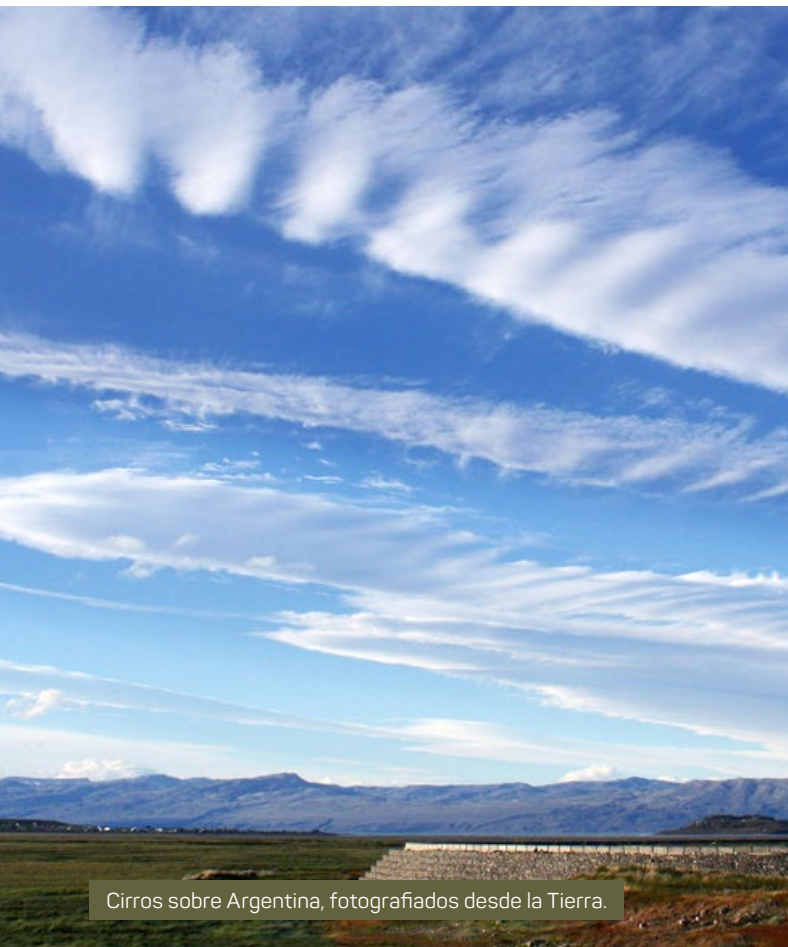
Cirros sobre Argentina, fotografiados desde la Tierra.

Los científicos estudian las nubes desde el espacio y desde la Tierra.