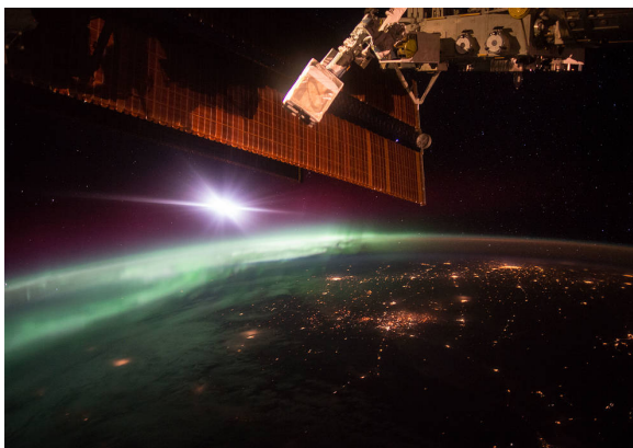
Imagen de una aurora en la Tierra tomada desde la Estación Espacial Internacional.

El campo magnético del Sol se extiende hacia el espacio y envía poderosas ráfagas de energía magnética hacia el sistema solar. En esta actividad, las pequeñas piezas de metal sobre la superficie del globo del Sol revelan algunas de las formas en que estos campos magnéticos interactúan. A veces las líneas de los campos magnéticos son rectas