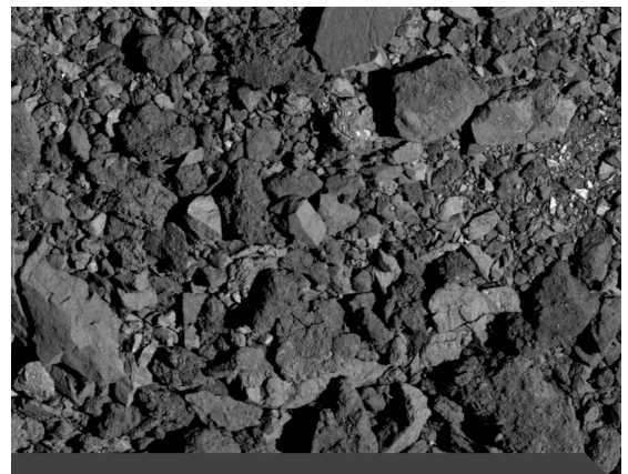
Muchos asteroides tienen superficies rocosas cubiertas de escombros. Esta imagen de primer plano del asteroide Benu es de la misión OSIRIS-REx de la NASA en 2019.

La misión Psyche, cuyo lanzamiento está previsto para el 2022, visitará un asteroide llamado Psyche que orbita entre Marte y Júpiter. Psyche es un asteroide insólito, compuesto de metales como el hierro y el níquel en vez de roca. Hay varias hipótesis acerca de cómo se formó Psyche, pero algunos científicos creen que podría ser el núcleo de un planeta cuya capa exterior fue arrancada por un enorme impacto.