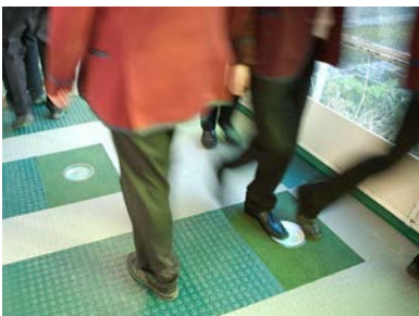
Azulejos de pisos generan electricidad cuando caminan sobre ellos

La manera como se comporta un material en la macroescala depende de su estructura en la nanoescala. Cuando aprietas un cristal piezoeléctrico, la longitud de ese cristal puede variar sólo unos nanómetros, o quizás menos (un nanómetro es la mil millonésima parte de un metro), pero ese pequeño cambio es suficiente para hacer que ese material genere electricidad.