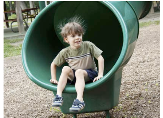
La electricidad estática se construye en capas

También ves electricidad estática cuando te quitas un suéter de lana y tu cabello se pone de punta, o cuando sientes un golpe de corriente después de caminar sobre una alfombra.